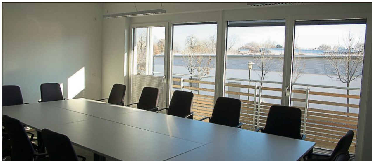
Der große Besprechungsraum im ersten Stock