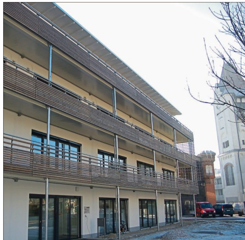
Ein Blickfang des Gebäudes sind die Rundumbalkone.

Die größte planerische Herausforderung habe aber darin bestanden, das Gebäude auf eine bereits vorhandene Tiefgarage zu bauen. „Doch die etwa 20 am Bau beteiligten Firmen haben alle an einem Strang gezogen“, sagt Geschäftsführer Emmerling. Deshalb habe man den vorgegebenen Zeitplan auch einhalten können.